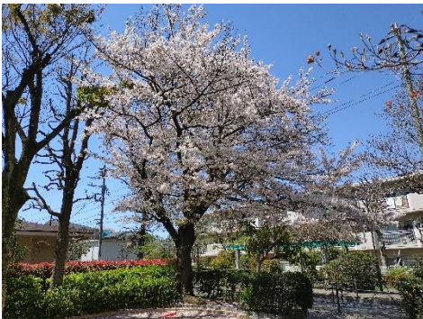
④なんごう児童遊園の染井吉野が満開（4月10日）