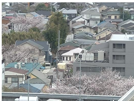
③順天堂練馬病院からの石神井東中学の桜の眺め（4月6日）