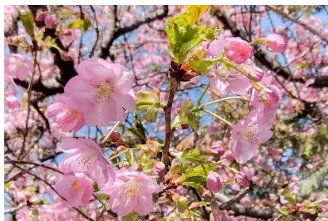
①長命寺の河津桜が満開（2月24日）